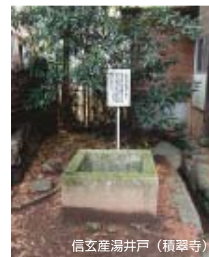
信玄産湯井戸（積翠寺）

武田軍団の中でとりわけ優れた24人の武将たち。その中でも片目を失い、片足も負傷した満身創痍の謎の武将が山本勘助でした。彼もまた若い頃から諸