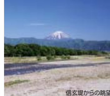
信玄堤からの眺望