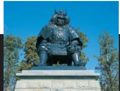
信玄公像（甲府駅前）